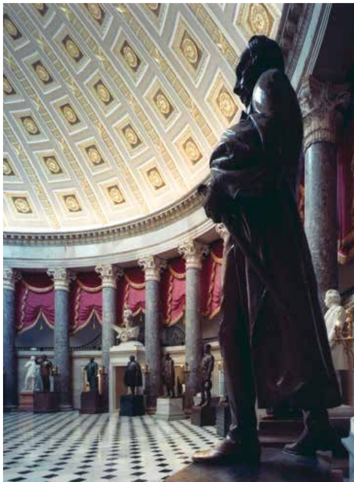
В Старом зале Палаты сейчас размещается Национальный скульптурный зал.

Последним дополнением к Капитолию стал Центр обслуживания посетителей под Восточной площадью, строительство которого было окончено в 2008 году. В нем располагаются выставочный зал, кинозалы, ресторан, магазины сувениров и служебные помещения Капитолия. Из него можно также пройти в Библиотеку Конгресса.