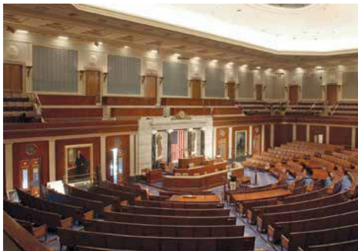
Зал заседаний Палаты представителей.