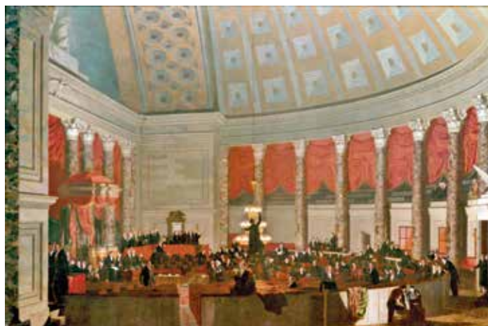
Старый зал Палаты представителей, Сэмюэль Ф. Б. Морзе, коллекция Национальной художественной галереи.

Сохраним художественную коллекцию Капитолия для будущих поколений! Любуйтесь картинами и скульптурами, но пожалуйста не прикасайтесь к ним.