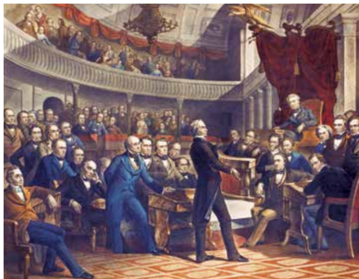
Сенатор Генри Клей выступает в защиту Компромисса 1850 года в Старой палате Сената.

К 1850 году в состав США вошло столько новых штатов, что появилась необходимость в расширении помещений Палаты