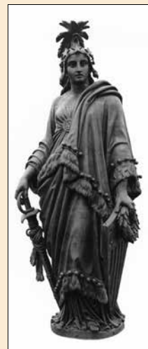
Купол увенчан Статуей Свободы.