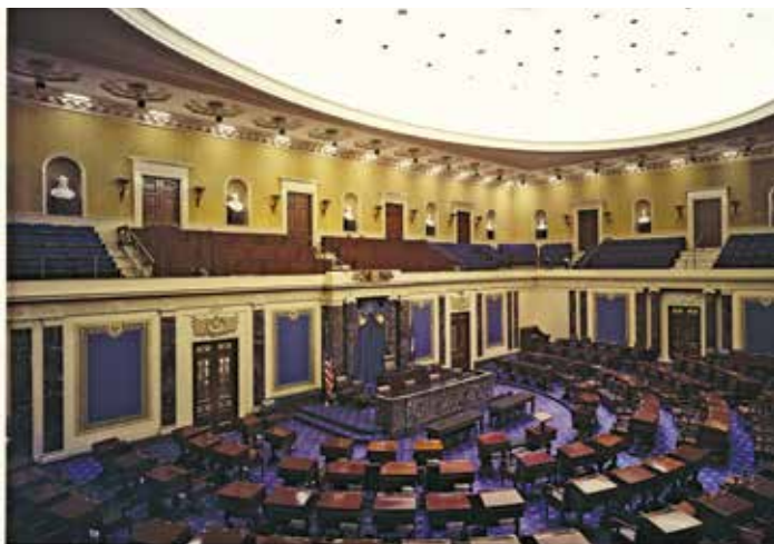
Зал заседаний Сената.

Если представитель умирает или досрочно покидает свой пост, проводятся специальные выборы на освободившееся