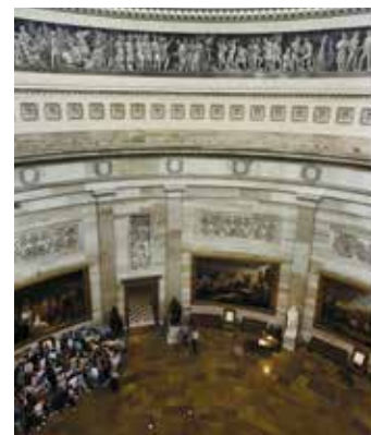
Посещение Ротонды является одним из самых запоминающихся моментов экскурсии

Дополнительную информацию о Капитолии, Палате представителей и Сенате можно получить на сайтах www.aoc.gov , www.house.gov и www.senate.gov .