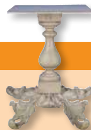
▲ リンカーンのテーブル、マサチューセッツ州歴史協会

棺— 遺体の埋葬前一般公開式典で大統領や他の著名人の棺を安置するためのものです。(展示ホール)