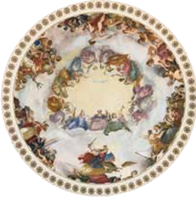
ዘ አፖስቶሎች ስር ጆርጅ ዋሽንግተን

ታ ሪካዊው የዩኤስ ካፒቶል ጉብኝትዎ የሚጀምረው ወደ ካፒቶል የጎብኚዎች ማዕከል ሲገቡ ነው። የካፒቶል ጎብኚዎች ማዕከል እጅግ የዘለገ ቁመት ባለው ጉልላቱና ብርሃን በሚያሳልፈው ጣሪያው አዲስ ዕውቀት ወደ ሚሽንምቱበት ጉብኝት ይቀበልዎታል። የዩኤስ ካፒቶል የዩኤስ ኮንግረስና የሁለቱ ሕግ