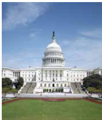
La facciata occidentale del Campidoglio guarda verso la National Mall .