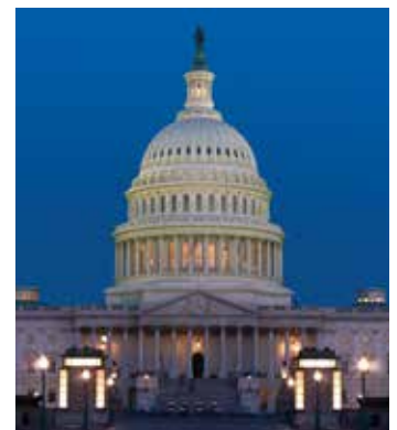
Campidoglio degli Stati Uniti

Il Congresso è il ramo legislativo del governo federale che rappresenta il popolo americano ed emana le leggi della nazione. Condivide il potere con il ramo esecutivo, guidato dal Presidente, e quello giudiziale, il cui massimo organo è la Corte Suprema degli Stati Uniti. Dei tre rami del governo, il Congresso è l'unico ad essere eletto direttamente dal popolo .