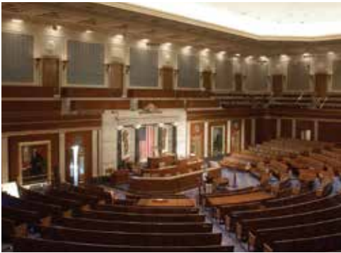
Camera dei Rappresentanti