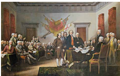
Questo dipinto raffigura il momento del 28 giugno 1776, quando la prima bozza della Dichiarazione d'indipendenza fu presentata al Secondo Congresso Continentale. Il documento dichiarava i principi per i quali si combatteva la Guerra d'indipendenza americana, principi che restano fondamentali per la nazione. Meno di una settimana dopo, il 4 luglio 1776, la Dichiarazione veniva adottata ufficialmente.

Nella Rotonda, otto nicchie incorniciate ospitano dipinti storici di grandi dimensioni. Quattro scene del periodo rivoluzionario furono commissionate nel 1817 dal Congresso all'artista John Trumbull: La Dichiarazione d'indipendenza , La resa del generale Burgoyne , La resa di Lord Cornwallis e George Washington rassegna al Congresso le sue dimissioni come comandante in capo dell'esercito . Questi quadri furono installati nella Rotonda tra il 1819 e il 1824. Quattro scene raffiguranti le prime esplorazioni furono aggiunte tra il 1840 e il 1855: Lo sbarco di Colombo di John Vanderlyn, La scoperta del Mississippi di William Powell, Il battesimo di Pocahontas di John Chapman e L'imbarco dei Pellegrini di Robert Weir.