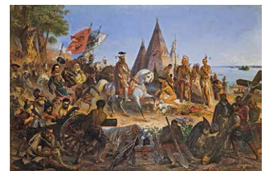
La scoperta del Mississippi da parte di De Soto