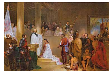
Il battesimo di Pocahontas