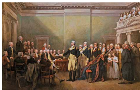
Il dipinto di George Washington che rassegna le sue dimissioni al Congresso, di John Trumbull, raffigura la scena del 23 dicembre 1783, nel Campidoglio del Maryland ad Annapolis, quando Washington diede le dimissioni da comandante in capo dell'Esercito Continentale. Si tratta di un gesto importante che stabiliva il primato dell'autorit  civile rispetto a quella militare, un principio fondamentale della democrazia americana.