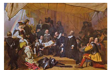
L'imbarco dei Pellegrini