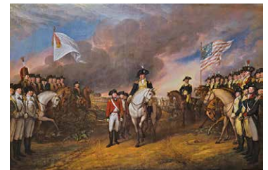
La resa di Lord Cornwallis