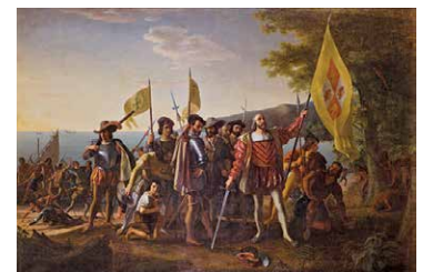
Lo sbarco di Colombo