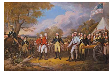
La resa del generale Burgoyne