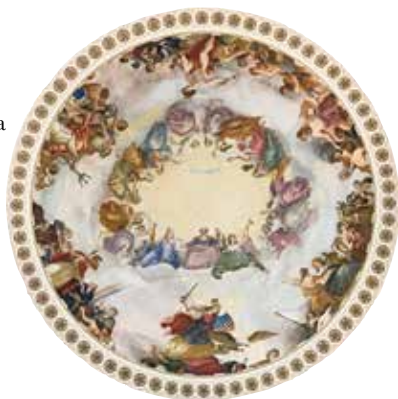
La apoteosis de George Washington

S u visita al edificio histórico del Capitolio de los Estados Unidos comienza en cuanto entra al Centro de Visitantes del Capitolio. Con sus cielos rasos altísimos y sus vistas a través de los tragaluces de la cúpula capitolina, el Centro de Visitantes del Capitolio les da la bienvenida a un viaje de descubrimiento.