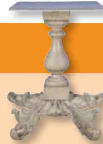
▲ Mesa de Lincoln, Sociedad histórica de Massachusetts

Catafalco: Armazón donde se colocan los féretros de los presidentes y de otros ciudadanos eminentes en los funerales de Estado ( Salón de Exposiciones ).