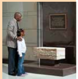
▲ リンカーンのテーブル、マサチューセッツ州歴史協会

棺— 遺体の埋葬前一般公開式典で大統領や他の著名人の棺を安置するためのものです。(展示ホール)