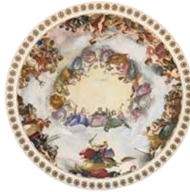
لوحة تجميد جورج واشنطن

تبدأ الجولات بمرافقة المرشدين داخل مبنى الكابيتول في واحد من المسرحين التوجيهيين في الطابق السفلي لمركز الزوار بالكابيتول. ويصف فيلم "من ضمن كثيرين، يبرز واحد" ومدته 13 دقيقة، كيف أسس هذا البلد شكلاً جديداً من الحكومات؛ ويُبرز الدور الحيوي الذي يلعبه الكونغرس في الحياة اليومية للشعب الأمريكي؛ كما يعطيكم فكرة عامة عن المبنى الذي يضم الكونغرس الأمريكي.