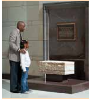
المعلم التذكاري لعمالة الرقيق

مجموعة التماثيل — هناك 24 من مجموع 100 تمثال من مجموعة قاعة التماثيل الوطنية معروضة في كل أنحاء مركز زوار مبنى الكابيتول، بما فيها 14 تمثالاً في قاعة التحرير (أنظر الصفحات التالية بهذا الكتيب للتعرف على وصف التماثيل).