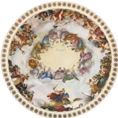
ዘ አፖቴሎሲስ አፍ ጆርጅ ዋሽንግተን

ታ ሪካዊው የዩኤስ ካፒቶል ጉብኝት የሚጀምረው ወደ ካፒቶል የጎብኚዎች ማዕከል ሲገቡ ነው። የካፒቶል ጎብኚዎች ማዕከል እጅግ የዘለገ ቁመት ባለው ጉልላቱና ብርሃን በሚያሳልፈው ጣሪያው አዲስ ዕውቀት ወደ ሚሽምቱበት ጉብኝት ይቀበልዎታል። የዩኤስ ካፒቶል የዩኤስ ኮንግረስና የሁለቱ ሕግ አውጪ አካል የሆኑት የዩኤስ የእንደራሴዎች ምክር ቤትና የዩኤስ ሴኔት መቀመጫ ነው። በፊልሞች፣ በአውደ ርዕዮችና በጉብኝት ኮንግረስ እንዴት እንደሚሰሩ፣ ታላቁ ሕንጻው እንዴት እንደተገነባና ዜጎች የውክልና ዴሞክራሲ በመባል በሚታወቀው ከፍተኛ ትርጉም ባለው ሂደት እንዴት እንደሚሳተፉ ትምህርት ይቀሰማሉ።