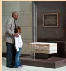
የባሪያ ጉልበት መዘከሪያ ምልክት

የባሪያ ጉልበት መዘከሪያ ምልክት:- ባሪያ የጉልበት ሠራተኞች በካፒቶል ግንባታ ላደረጉት አስተዋጽኦ ዕውቅና የመስጠት ሚና ያለው በድንጋይ የተሰራ ምልክት። (ኢ.ማንስፔሽን አዳራሽ)